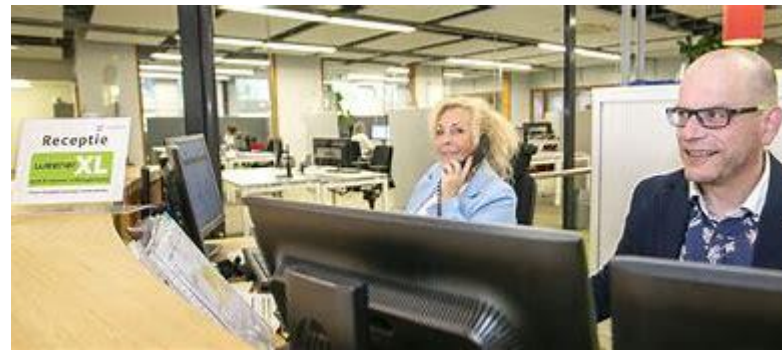
Counterwork, Administration & facility