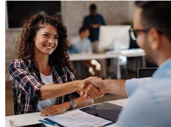
Finding a job (int + ext)