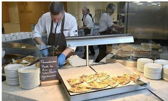
Catering company canteen