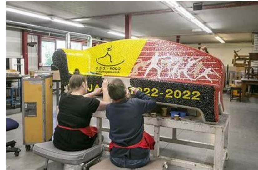
Work-related daytime activities